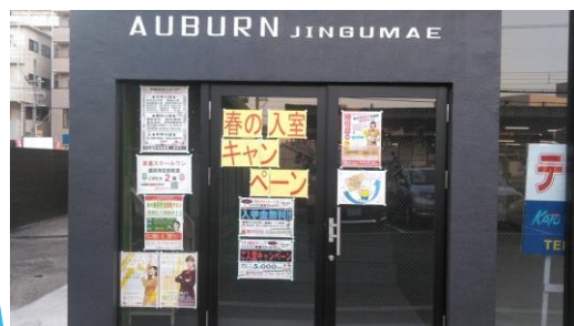
教室ビル入口・教室入口