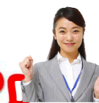
合格率のちがいは