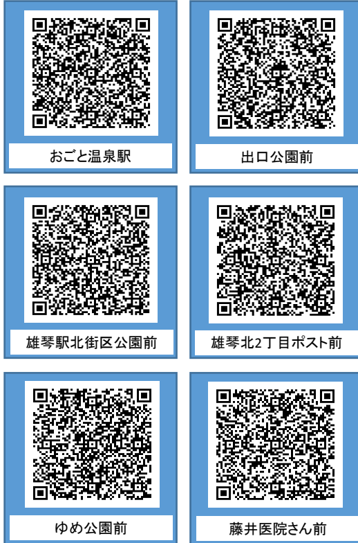
堅田校バスルート【2019年3月～】

各バス停付近の写真をそれぞれ載せています。 QRコードを読み取ってご確認ください。