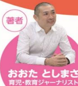
著者 おおた としまさ 育児・教育ジャーナリスト