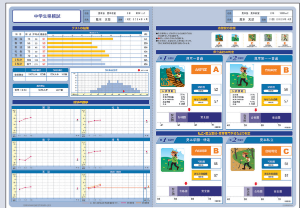
中学1・2年生 個人成績表見本